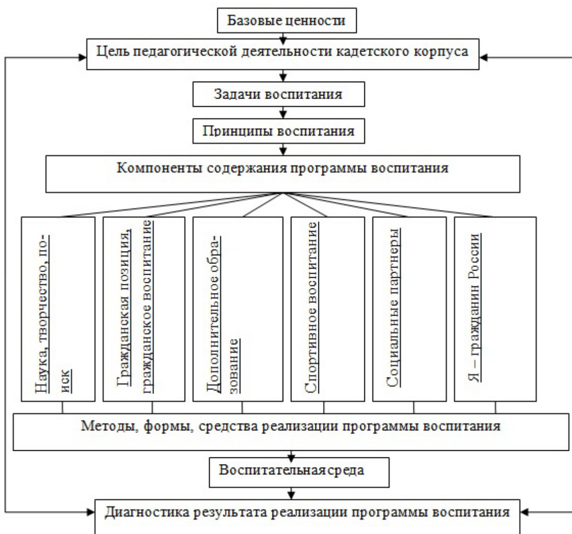
Рисунок 1. Модель системы воспитания