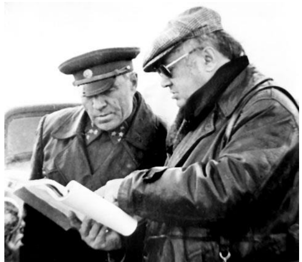
Михаил Ульянов и Юрий Озеров на съемках фильма «Битва за Москву»