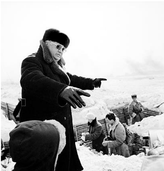
Юрий Озеров на съемках фильма «Битва за Москву»

Можно утверждать, что военные киноэпопеи Юрия Озерова стали не только частью золотого фонда советского кино, но и художественным памятником тем далеким годам.